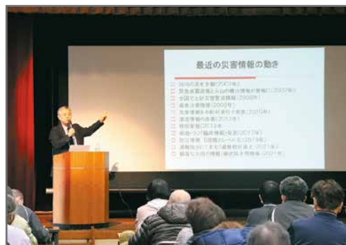
災害から命を守るために 2月18日(日)

令和6年能登半島地震における被災地支援のため、相生市社会福祉協議会では職員1名を七尾市災害ボランティアセンターに派遣しました。近畿ブロック内の社会福祉協議会では、1月25日より10名を1チームとして職員を派遣しています。現地では、ボランティア活動者へのオリエンテーションや活動内容の説明、被災者からの相談や現地調査などを行いました。引き続き息の長い支援が求められます。