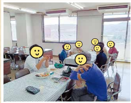
ゆったりおしゃべり会

不定期になりますが、農業体験などの屋外での行事も行っています。また、当事者だけでなく、当事者家族からの個別相談も受け付けています。一人で悩まず、お気軽にご相談ください。